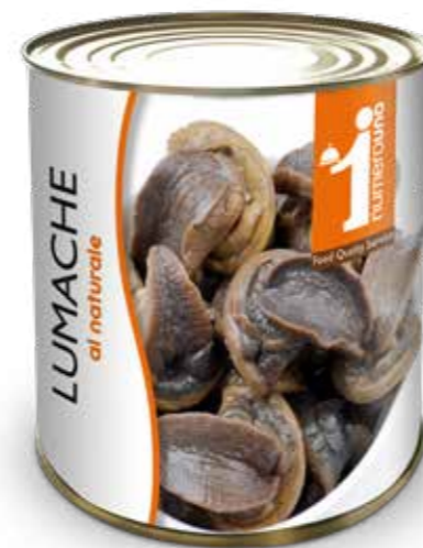
900 Lumache al naturale 800g

“ Un aiuto in cucina, sempre pronti all'uso, gustosi e pratici ”