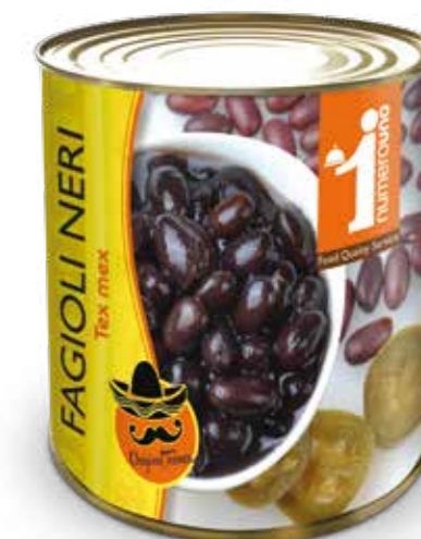
948 Fagioli neri tex mex 820g