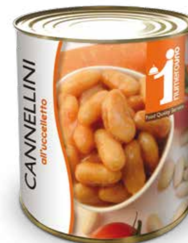
950 Cannellini all'uccelletto 800g