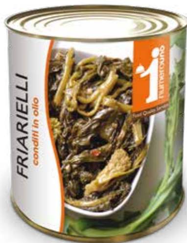
104 Friarelli conditi in olio 750g