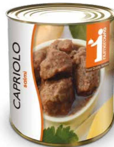
903 Salmi di capriolo 800g