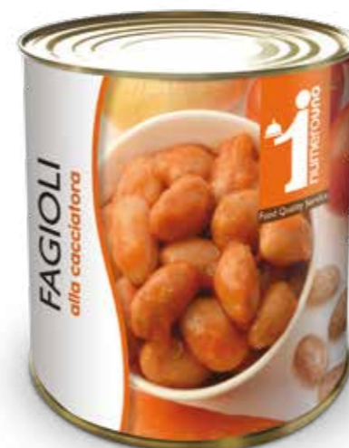
949 Fagioli alla cacciatora 800g