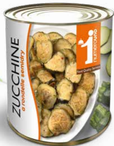
108 Zucchine a rondelle semidry 770g