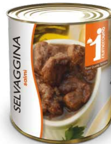
902 Salmi di selvaggina 800g