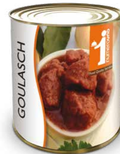
904 Goulasch 800g