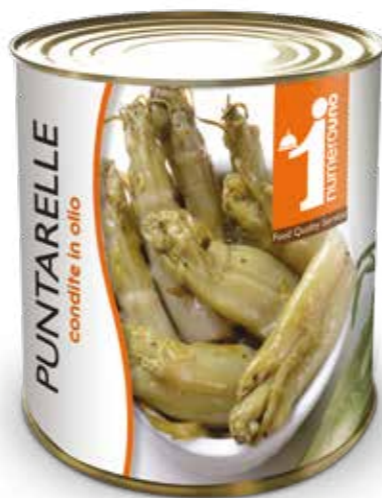
107 Puntarelle condite in olio 750g