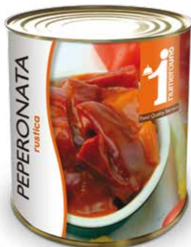
101 Peperonata rustica 800g

“ Un aiuto in cucina, sempre pronti all'uso, gustosi e pratici ”