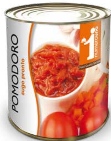
602 Sugo al pomodoro 800g