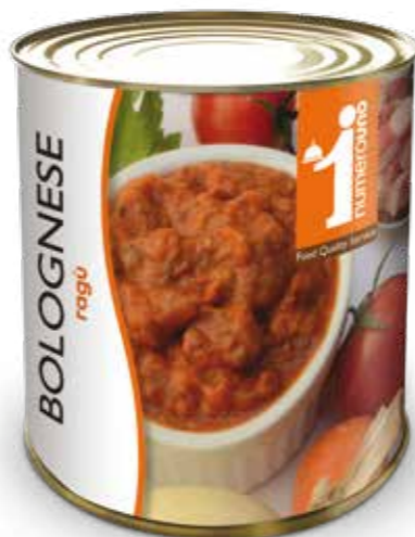
603 Ragù alla bolognese 800g