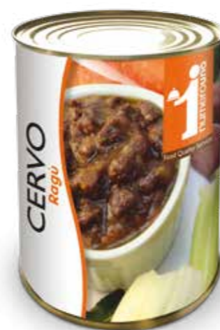
648 Ragù di cervo 400g