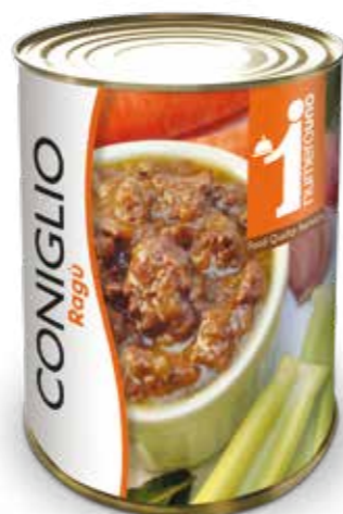
605 Ragù di coniglio 400g