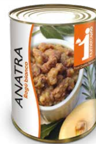
644 Ragù bianco di anatra 400g