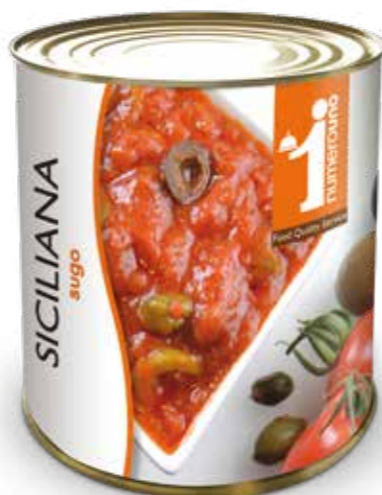
601 Sugo alla siciliana 800g