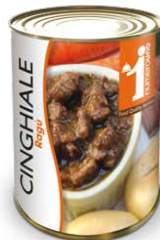
649 Ragù di cinghiale 400g