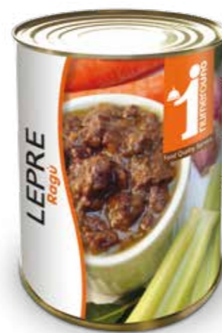
650 Ragù di lepore 400g