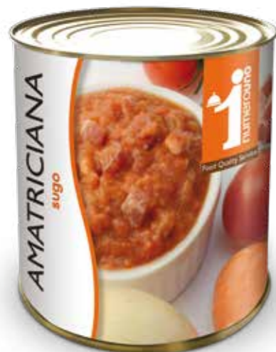
604 Sugo all'amatriciana 800g