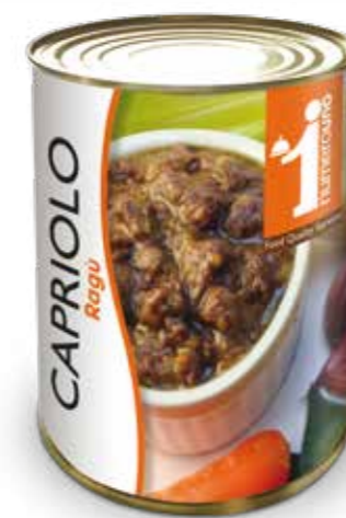
646 Ragù di capriolo 400g