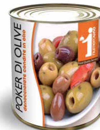
809 Mix di olive denocciolate condite in olio 780g