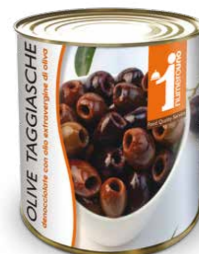
801 Olive Taggiasche denocciolate con olio extravergine di oliva 730g