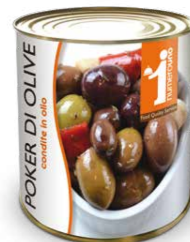
806 Poker di olive intere condite in olio 780g