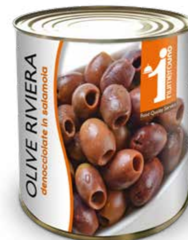
804 Olive Riviera denocciolate in salamoia 780g

“Un vero classico per dare gusto ad ogni aperitivo disponibile in molte varietà e tipi di preparazione”