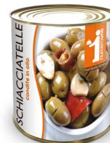
808 Schiacciatelle condite in olio 780g