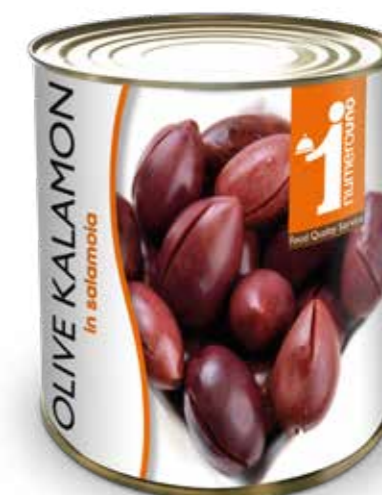
807 Olive kalamon in salamoia 780g