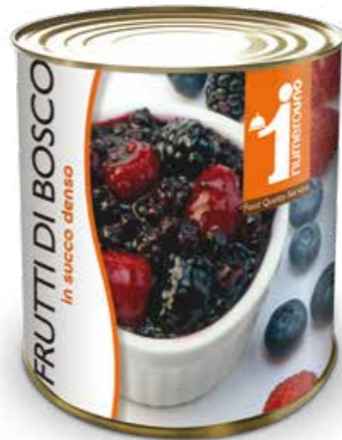
202 Frutti di bosco in succo denso 880g