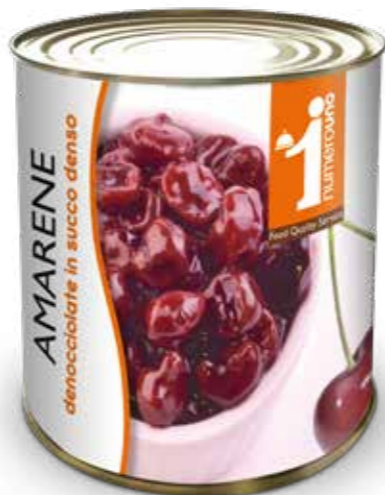
201 Amarene denocciate in succo denso 880g