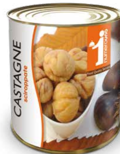
205 Castagne sciropate 850g