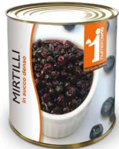
204 Mirtili in succo denso 880g