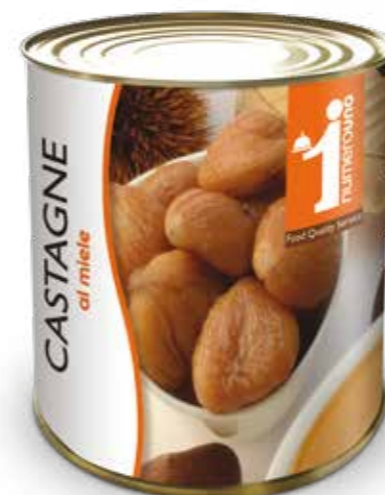
206 Castagne al miele 1Kg