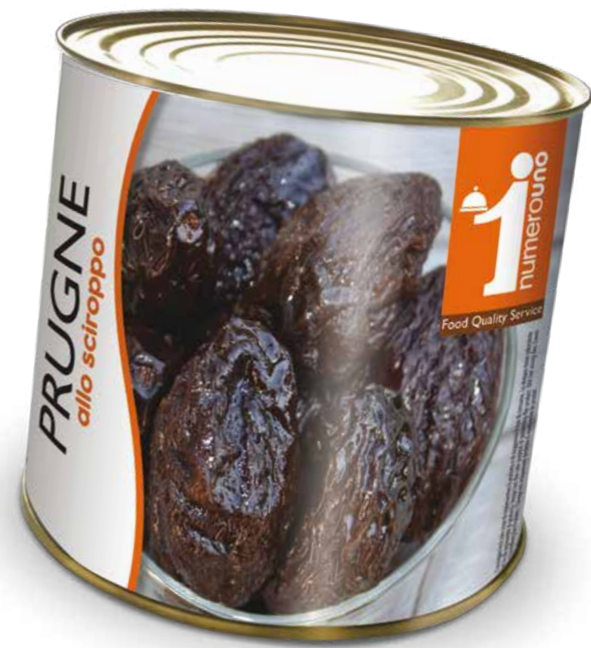
211 Prugne allo sciroppo 800g 212 Prugne allo sciroppo 2,5kg

“ Ideali per arricchire ed esaltare la preparazione o guarnizione di dolci ”