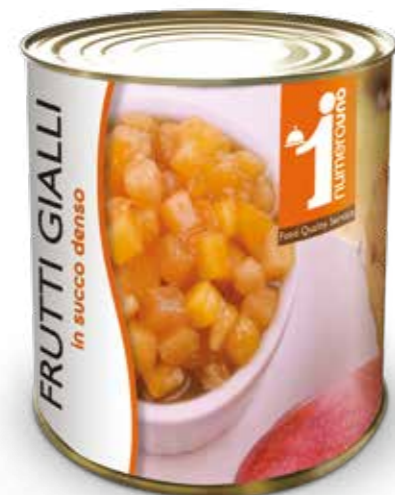
210 Frutti gialli in succo denso 880g