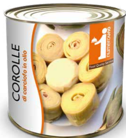
67 Corolle di carciofo in olio 2500g