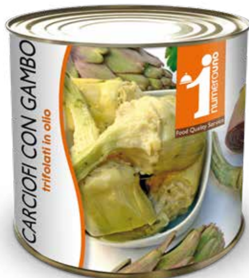
62 Carciofi con gambo trifolati in olio 780g