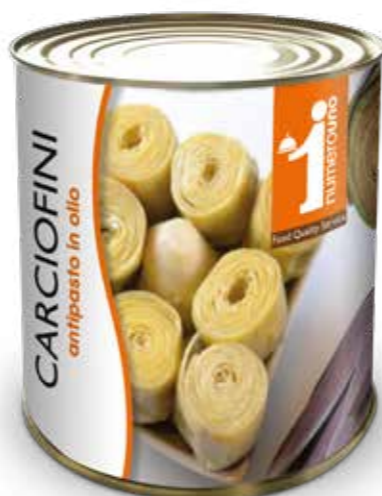
51 Carciofini piccoli interi in olio 780g