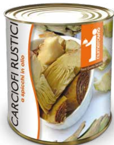
53 Carciofi rustici a spicchi in olio 780g