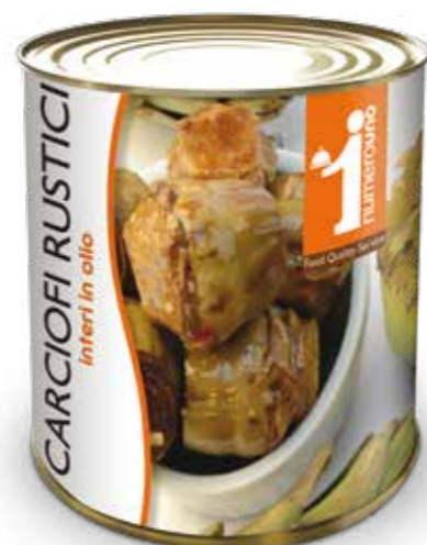
52 Carciofi rustici interi in olio 780g