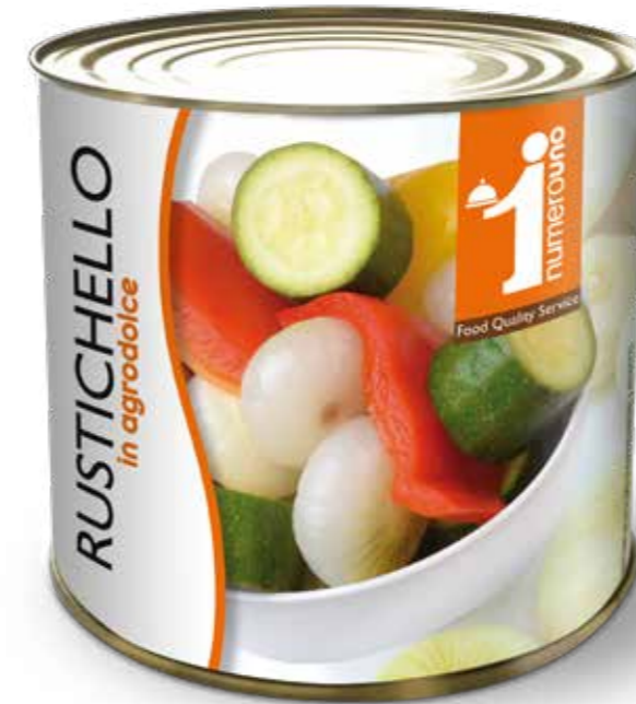
720 Rustichello in agrodolce 2650g