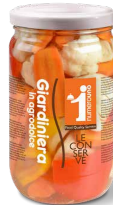
717 Giardiniera classica in agrodolce 1650g