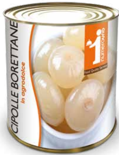
702 Cipolle Borettane in agrodolce 800g 711 Cipolle Borettane in agrodolce 2600g