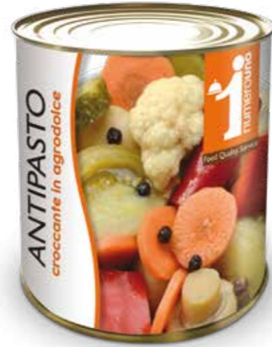
708 Antipasto croccante in agrodolce 800g