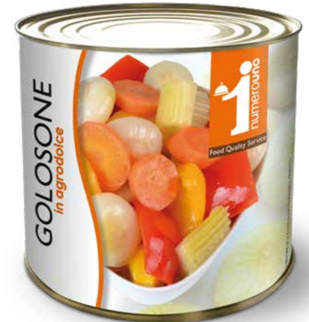
704 Golosone in agrodolce 2600g