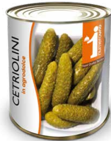
706 Cetriolini in agrodolce 800g