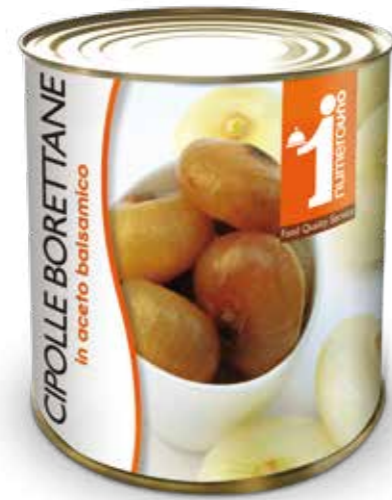
701 Cipolle Borettane in aceto balsamico 800g 710 Cipolle Borettane in aceto balsamico 2600g