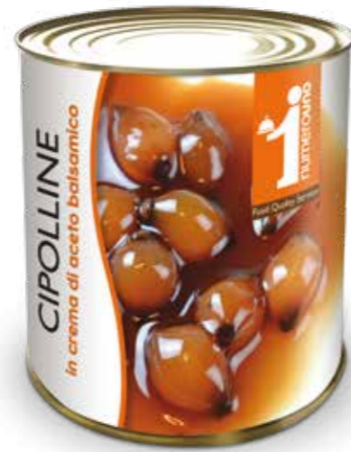
703 Cipolline in crema di aceto balsamico 860g