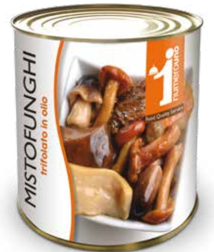
251 Mistofunghi trifolato in olio - 5 varietà 800g