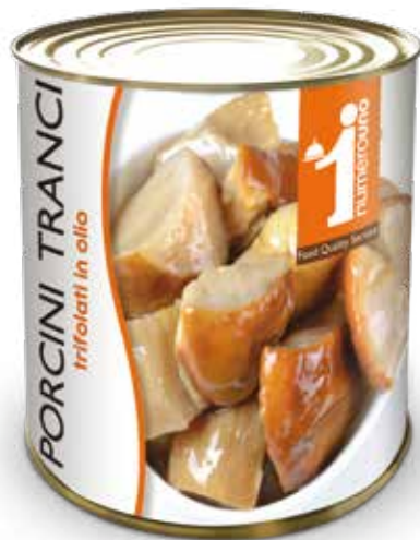
504 Porcini tranci trifolati in olio 800g