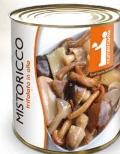
255 Mistoricco trifolato in olio - 7 varietà 800g