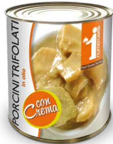
503 Porcini trifolati con crema 800g