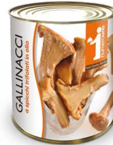
258 Gallinacci a spicchi trifolati in olio 750g