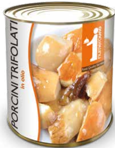
502 Porcini trifolati in olio 800g