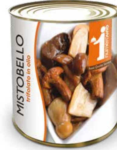
254 Mistobello trifolato in olio - 4 varietà 800g