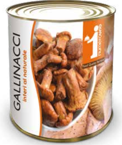
259 Gallinacci interi al naturale 750g