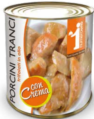
506 Porcini tranci trifolati con crema 800g