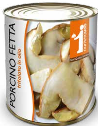
512 Porcino fetta trifolato in olio 750g