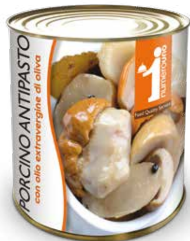
510 Porcino antipasto con olio extravergine di oliva 750g