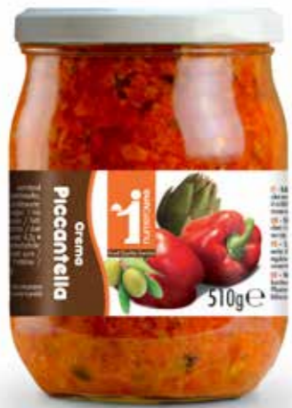
190 Piccantella, crema di verdure piccanti 510g