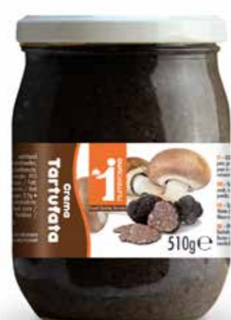
187 Tartufata scura 510g