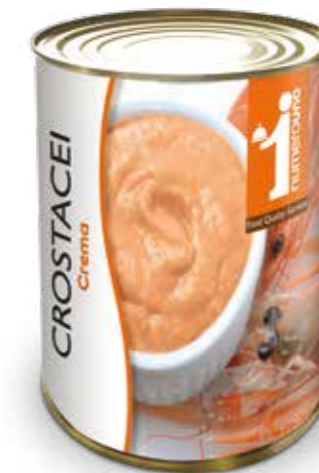
163 Crema di crostacei 400g