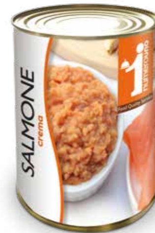
164 Crema di salmone 400g