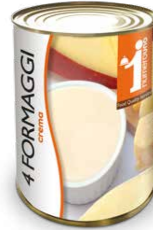
154 Crema 4 formaggi 400g