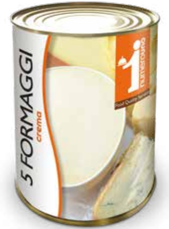
156 Crema 5 formaggi 400g