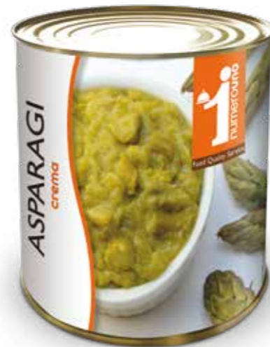
152 Crema di asparagi 800g