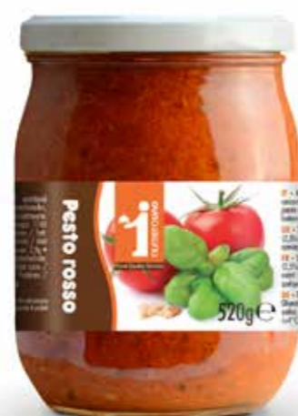
193 Pesto rosso 520g