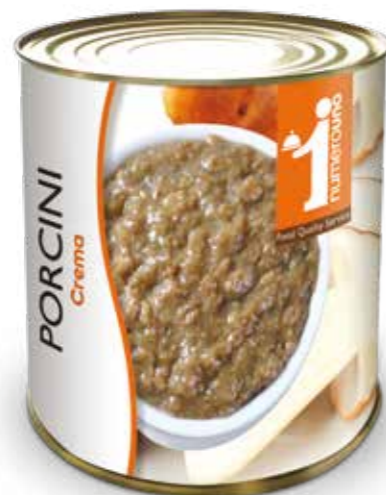
158 Crema di porcini 800g