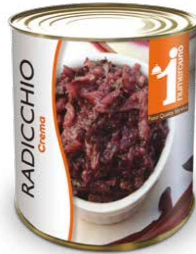
160 Crema di radicchio 800g