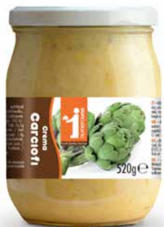
184 Crema di carciofi 520g