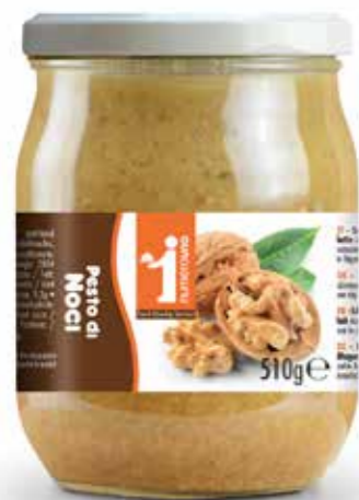
186 Pesto di noci 510g