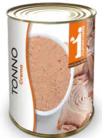
165 Crema di tonno 400g