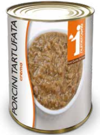
159 Crema di porcini tartufata 400g

“ Ideali come condimento per pasta e ottime da spalmare ”