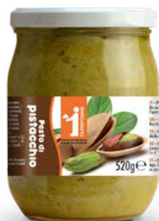
180 Pesto di pistacchio 520g

“ Ideali da spalmare, danno gusto e sapore a tramezzini, toast e panini ”