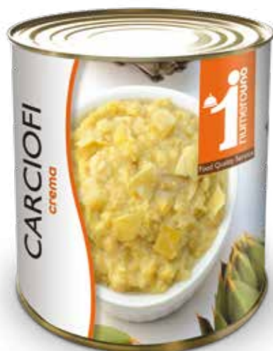
153 Crema di carciofi 800g