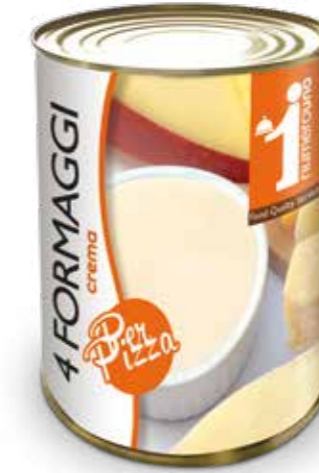
155 Crema 4 formaggi per pizza 400g