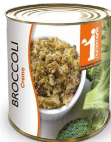
151 Crema di broccoli 780g