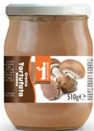
179 Tartufata chiara 510g