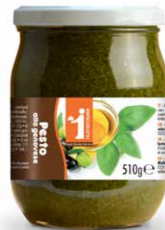
199 Pesto alla genovese 510g