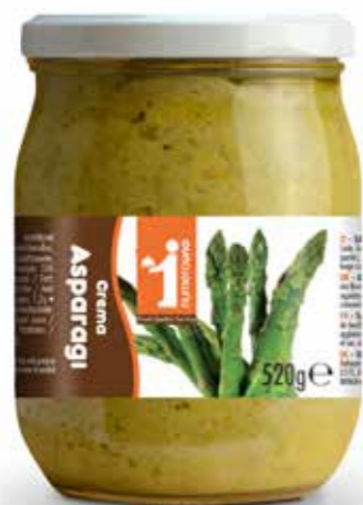
183 Crema di asparagi 520g