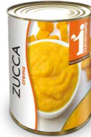
162 Crema di zucca 400g

“ Ideali come condimento per pasta e ottime da spalmare ”